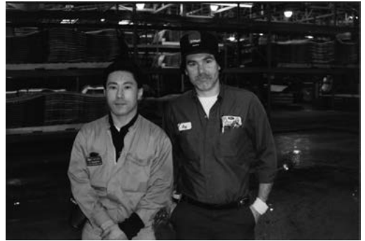
30歳。海外赴任地の米国・オハイオ州、フォードの工場で現地ワーカーと

大学アメフトでは、ラッシング（獲得ヤード数）全国2位など、個人記録保持者として月刊誌に載ったことも