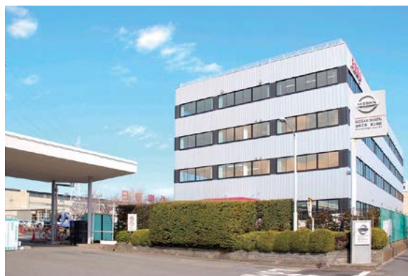
第1~3地区からなる湘南工場(写真は本社・第2地区)。市内・大神地区には開発部門のテクノセンター、隣接の秦野市には実験設備を擁する秦野事業所があります。

月に開催)。他にも県内生産量トップクラスを誇る「バラのまち」、そしてこれはご存じの方も多いと思いますが、「七夕のまち」です。新型コロナウイルス感染症の流行により2年連続で中止となりましたが、今年は3年ぶりに開催されました。駅構内には一年中豪華な七夕飾りがありますので、いつ来ても雰囲気味わえます。ぜひ、平塚市へ足を運んでみてください。