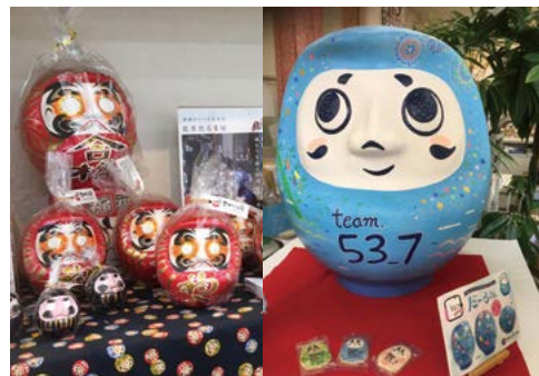
創業150年の「荒井だるま屋」さんは、創作だるま作りも得意。右は市に寄贈された「だるさん」。お腹の番号は、東海道五十三次(五十七次)の「平塚宿」にちなんだもの

月に開催)。他にも県内生産量トップクラスを誇る「バラのまち」、そしてこれはご存じの方も多いと思いますが、「七夕のまち」です。新型コロナウイルス感染症の流行により2年連続で中止となりましたが、今年は3年ぶりに開催されました。駅構内には一年中豪華な七夕飾りがありますので、いつ来ても雰囲気味わえます。ぜひ、平塚市へ足を運んでみてください。