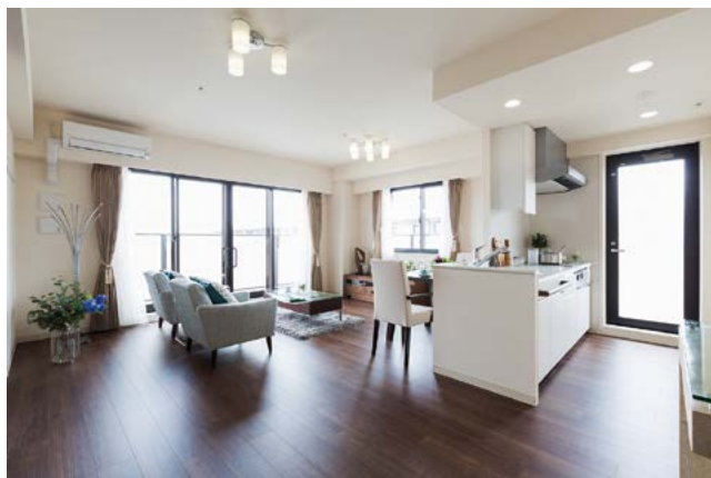
【サービス付き高齢者向け住宅】ラヴィーレレジデンス世田谷千歳台