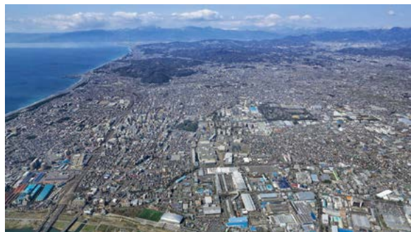
近年では、「圏央道(首都圏中央連絡自動車道)」、「さがみ縦貫道路」の開通で便利になり、湘南を訪れる人の流れも変わりつつあります。

ふたつ目は、「囲碁のまち」です。昭和初期の棋士で、生涯で50人を超えるプロ棋士を育てた木谷実九段の「木谷道場」があったことから、囲碁を市の特色ある文化として位置づけています。駅前商店街のプロムナードに1000面を並べてプロ棋士と対戦する「湘南ひらつか囲碁まつり」の多面打ち大会には、全国から参加者が集まります(毎年10