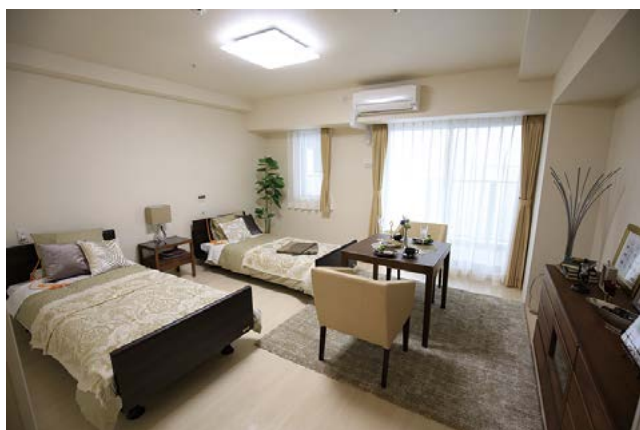
【介護付き有料老人ホーム】ラヴィーレグラン四谷

ともにご入居様に寄り添うコンシェルジュにより、日常のお困りごとや将来の相談、日々の楽しみやつながりづくりなど親身になって幅広く対応いたします。