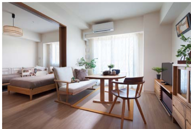
【サービス付き高齢者向け住宅】ラヴィーレレジデンス立石