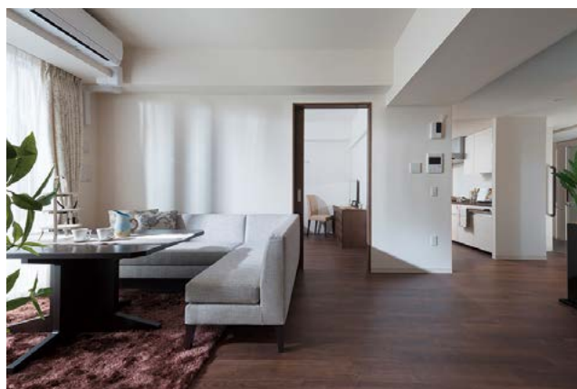
【サービス付き高齢者向け住宅】ラヴィーレレジデンス用賀