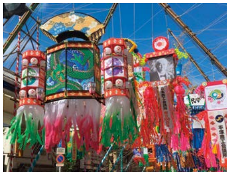
規模を縮小して7月8~10日に開催された、市制施行90周年記念「第70回湘南ひらつか七夕まつり」。駅前商店街を中心に彩られた、全国屈指の規模の七夕飾り(最大約18m)は圧巻