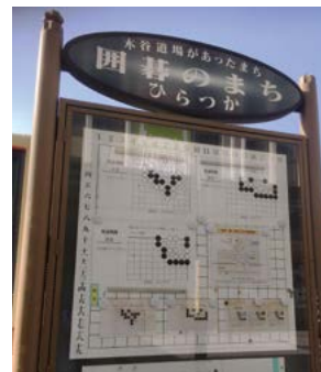
平塚市まちづくり財団では、年間を通じて囲碁教室や大会を開催しています。