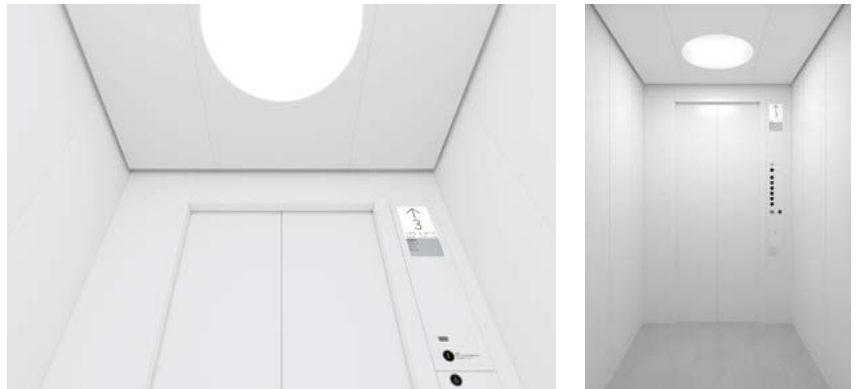
「アーバンエース HF」意匠デザインイメージ

「アーバンエース HF」は、約7年ぶりの標準型エレベーターの新モデルとして、日立昇降機製品・サービスの開発コンセプトである「HUMAN FRIENDLY(HF)」を具現化した製品で、深澤直人氏監修の新デザインと、最新の感染症リスク軽減ソリューションなどで新たなエレベーター利用体験を提供します。