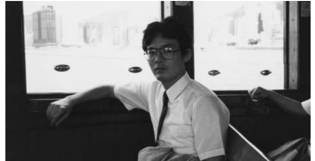
▲海外出張の際の一枚

で様々な事業に携わることができたのは、貴重な経験だったと思います。あのまま製錬営業の世界にいたら今のようなルートをたどることはなかったでしょう。そのように会社が使ってくれたというのが、今に至る一つの原点になっていると思います。