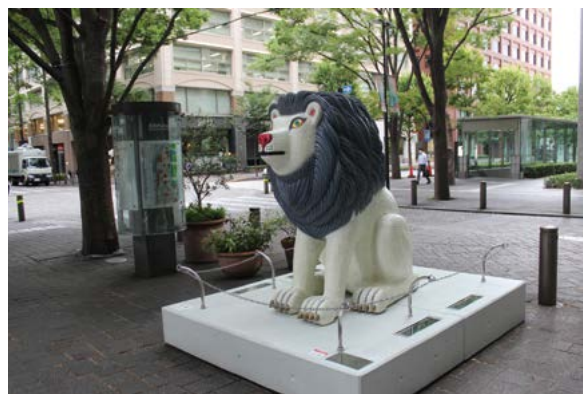
丸の内ストリートギャラリー「Animal 2016-01B」

三菱HCキャピタル 丸の内オフィス 東京都千代田区丸の内1-5-1 新丸の内ビルディング ☎03(6865)3002