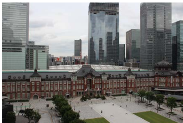
新丸の内ビルディング7階テラスから望む東京駅

歴史的建造物、モダンなオフィスビルや現代アートなど、さまざまな魅力を持った丸の内。みなさんも東京にお越しの際は、東京駅で降りて、丸の内の街を散策してはいかがでしょうか。