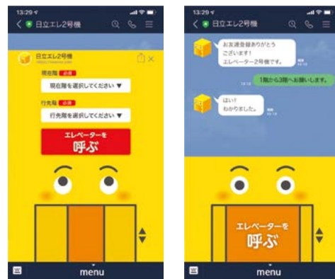
LINE連携タッチレスエレベーター呼びサービス「エレトモ」*の画面イメージ