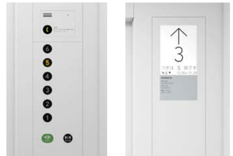
操作盤と押しボタン

乗りかご内の空気浄化やソーシャル・ディスタンスの確保、ボタンに手を触れない形でのエレベーター利用など、感染症リスクを軽減するさまざまなソリューションを適用しました。