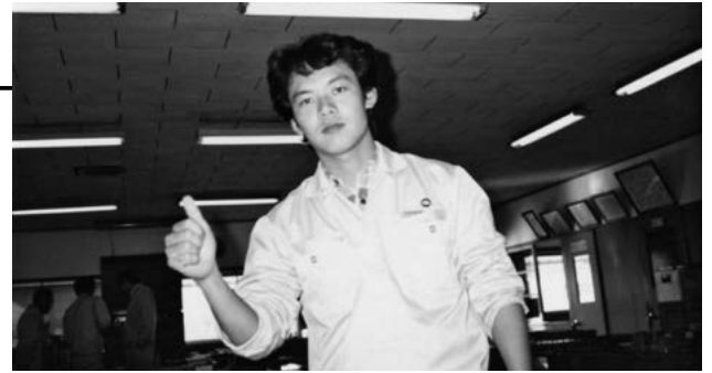
▲佐賀製錬所勤務時代

先ほども触れましたが、1993年に製錬営業から企画・管理系に異動した時です。環境リサイクル事業や機能材料事業などの管理・企画という視点