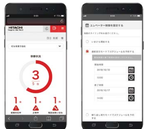
ビルオーナー・管理者向けダッシュボード「BUILLINK」の画面イメージ