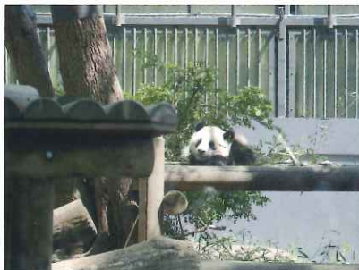
ジャイアントパンダの香香(2018年4月撮影)