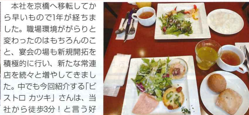
▲大満足!のランチメニュー