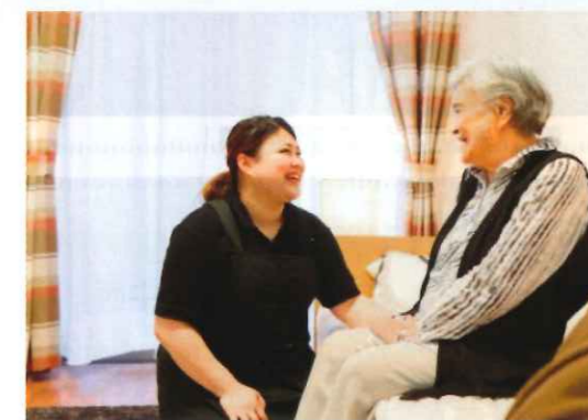
サービス付き高齢者向け住宅