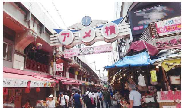
連日観光客で賑わうアメ横商店街