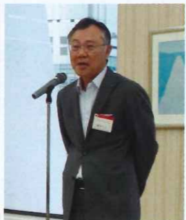
懇親会挨拶 櫻井事業協議会会員