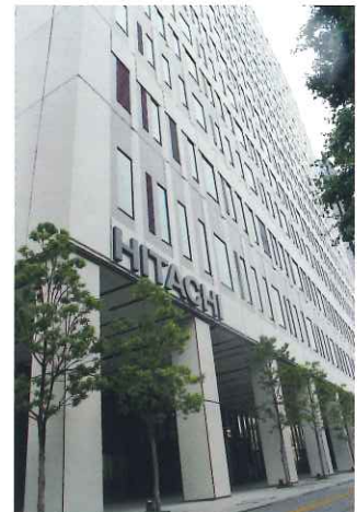
本社のある上野イーストタワー

今年6月より、香香の公開方法が、先着順で整理券を配る方法から並んだ順番に観覧できるように変わつたため、より多くの方が観覧できるようになりました。魅力たくさんの観光スポットめぐりと併せて、1歳になった香香に会いにみなさんぜひ上野、御徒町へお越し下さい。