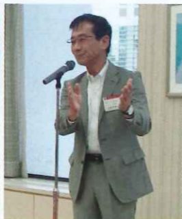
中締め 近藤事業協議会会員