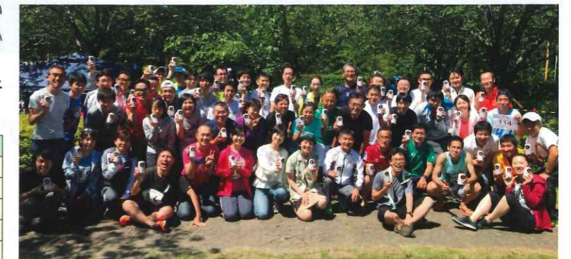
健闘をたたえ合い乾杯★