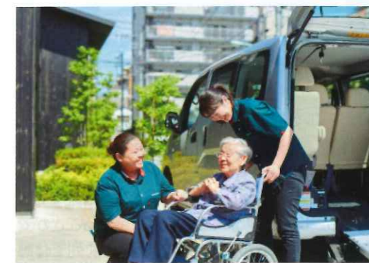
通所介護(デイサービス)

問合せ SOMPOケア 介護なんでも相談室 ☎0120-155-703 受付時間 午前9時～午後6時(土・日・祝日も受付)