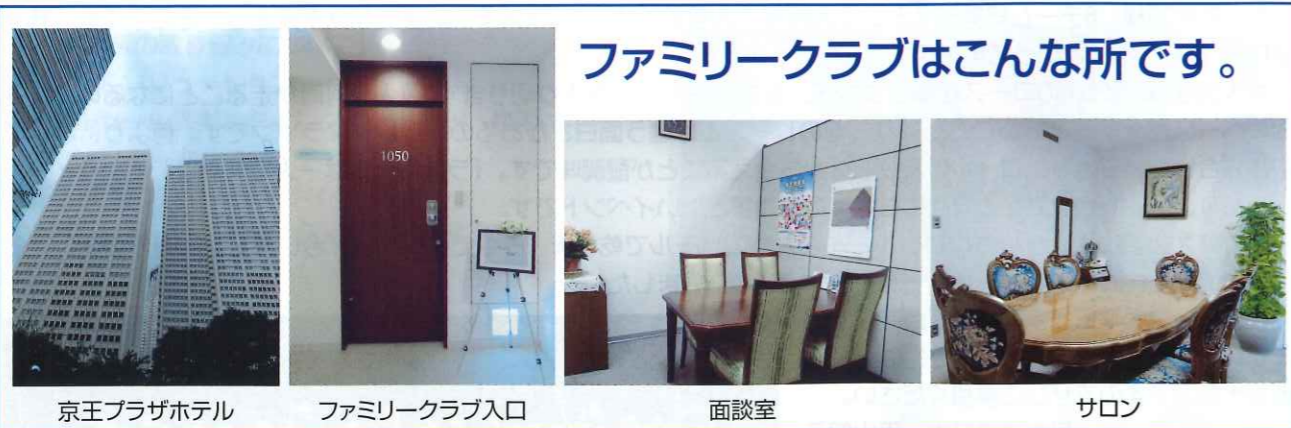
ファミリークラブはこんな所です。