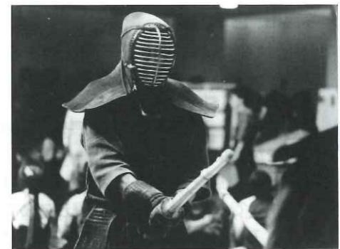
▼30代。ターニングポイントとなったという初めての北米赴任(前列左) 写真は20歳の時の昇段試験

その後、何度もリベンジマッチやケンカを繰り返して分かったことは、彼らはきっと「お前が正しい」とはいえ、まずはこちらの話を聞いてからにしろ」と言いたかったのだということです。日本でも同じですが、海外ならより一層、「モノをつくるときは、最初にコンセンサスを得て進めないといけない」ということを、ここで嫌というほど叩き込まれました。