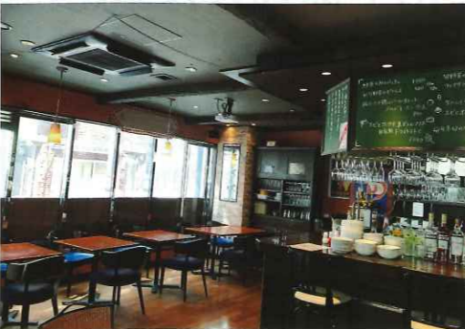
▲パリのビストロのような店内

本社を京橋へ移転してから早いもので1年が経ちました。職場環境ががらりと変わったのはもちろんのこと、宴会の場も新規開拓を積極的に行い、新たな常連店を続々と増やしてきました。中でも今回紹介する「ビストロ カツキ」さんは、当社から徒歩3分!と言う好立地にあり、モーニングからディナーまで、多くの社員が利用しています。お店を貸切にした懇親会での利用も多く、その度に、細かなリクエストに対応して下さる店員さんの人柄や、パリのビストロのような雰囲気と美味しい食事に毎回大満足しています。