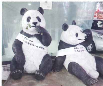
おかちまちパンダ広場の2頭のパンダが御徒町駅南口利用者をお出迎え