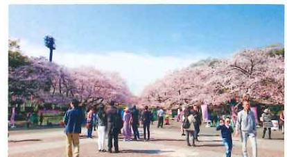
桜の名所、上野恩賜公園