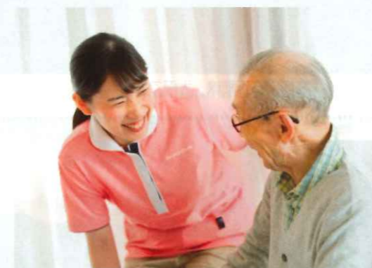
介護付きホーム(介護付有料老人ホーム)

私たちは「介護の総合ブランド」として、ご利用者さまの尊厳を守り、自立支援に資する介護を、全社一丸となって追求していきます。介護に関するお悩みなどがございましたらぜひSOMPOケアにご相談ください。