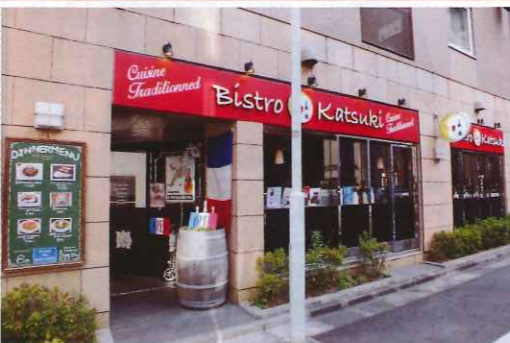
▲赤い看板が目印の外観