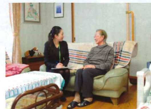
在宅介護サービス(訪問介護・夜間訪問介護・定期巡回等)