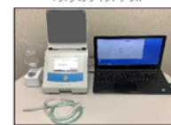
個人ばく露サンプラー